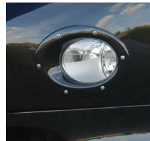
2010 model modification with additional lights