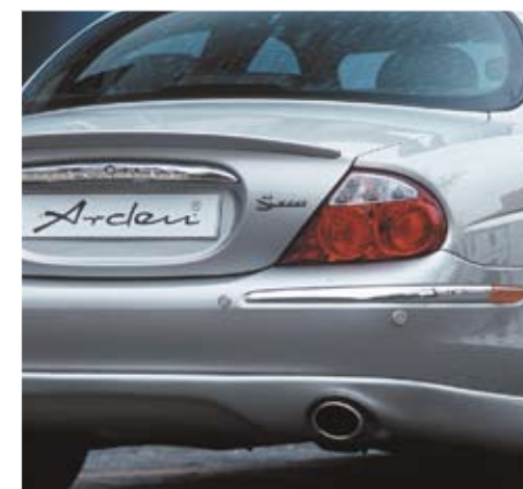
Rear valance with sport exhaust system