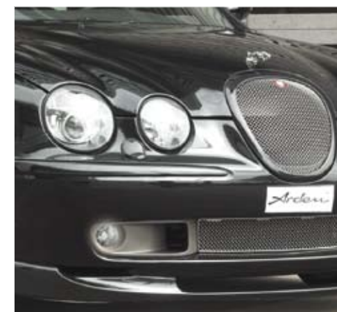
Additional ventilation with handcrafted stainless steel grilles