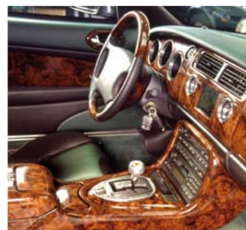
Individual Arden interior programme with leather and precious wood