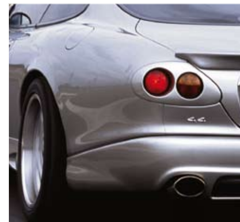
Arden double rear lights