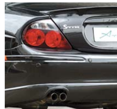
Rear valance and double exhaust system