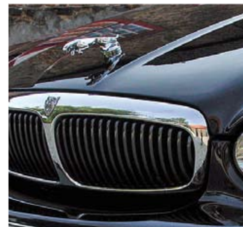
TÜV certified Arden Jaguar leaper