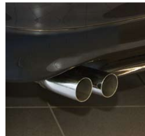
Arden Two Pipe Exhaust System