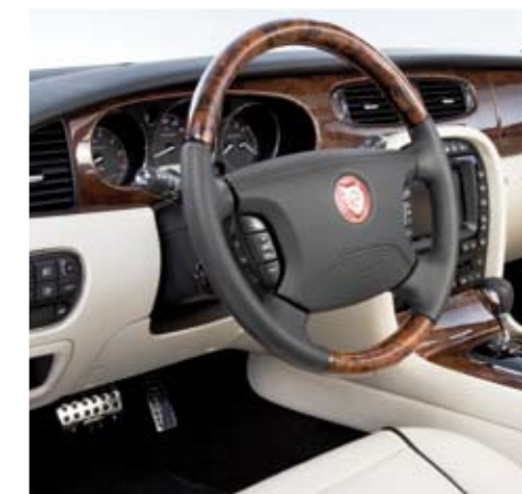
Individual Arden interior programme with leather and precious wood