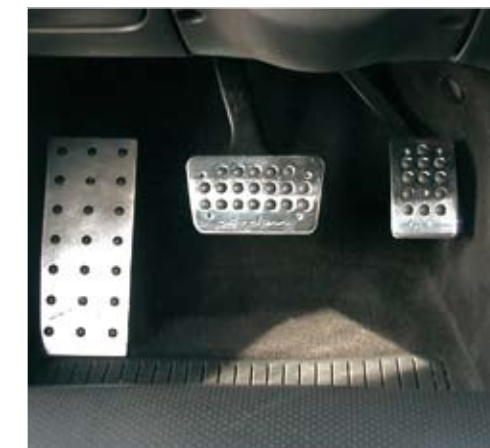
Arden aluminium foot pedals