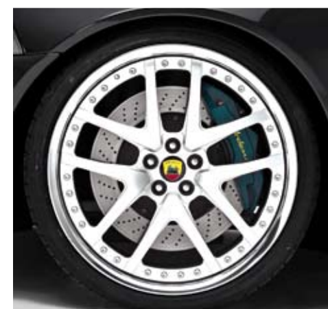
Sportline wheels L.M 9J x 21" and 10J x 21" with tyres 255/30R21 and 295/25R21