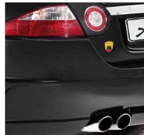
High performance exhaust system with 4 end pipes and backlight casing