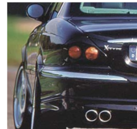
Rear valance with double pipes