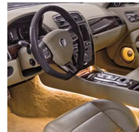
Arden steering wheel with ambient lighting