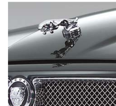
TÜV certified Arden Jaguar leaper