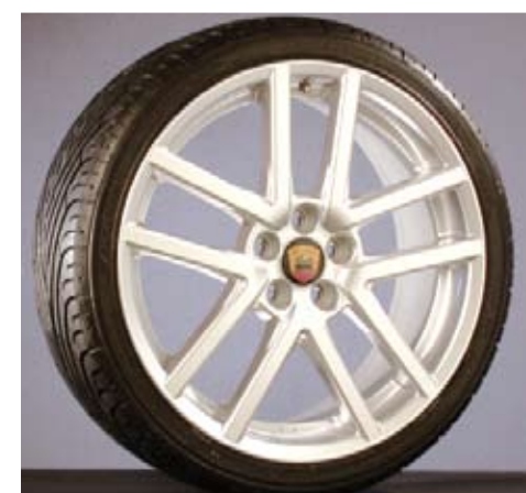
Sportline 8 x 18 and 8 x 19" wheel