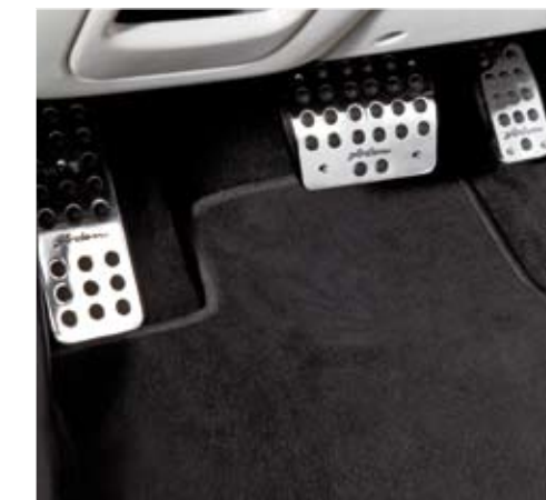
Arden aluminium foot pedals