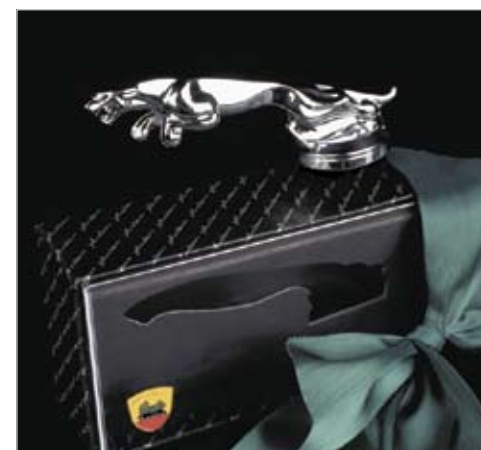
TÜV certified Arden Jaguar leaper