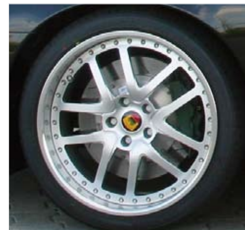
Sportline wheel L.M 9J x 21" and 10J x 21" with tyres 255/30R21 and 295/25R21