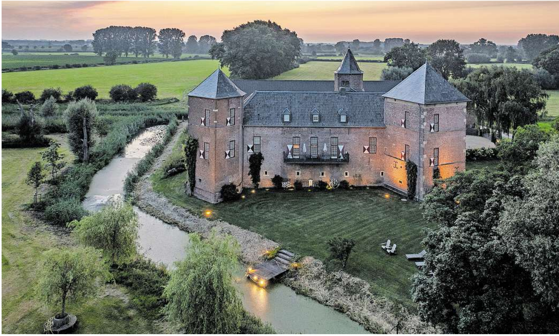
Der ehemalige Rittersitz Burg Zelem liegt im Herzen der Naturlandschaft Düffel. Die dreiflügelige Anlage stammt weitgehend aus der ersten Hälfte des 15. Jahrhunderts.