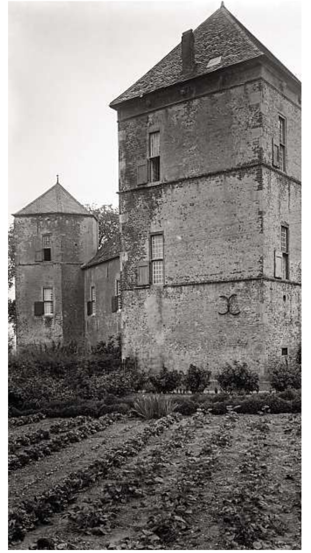
Burg Zelem 1953 – dem Untergang geweiht.